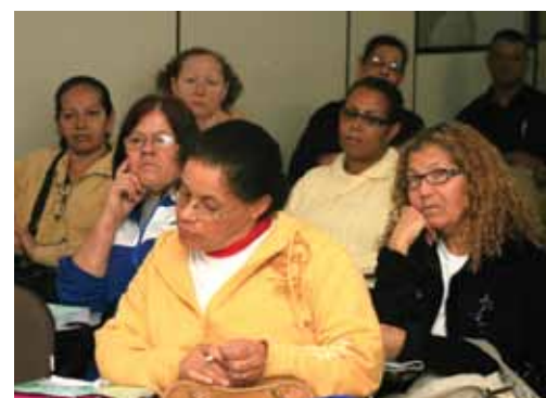
Funcionários da Educação também tem direito a opção de licença prêmio em dinheiro

O Sindicato vai continuar lutando para a liberação da opção em dinheiro para todos/as que assim queiram.