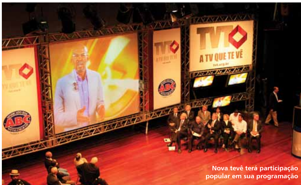
Nova tevê terá participação popular em sua programação

Com a presença do presidente Lula, de ministros e de autoridades da região do ABC foi inaugurada no final de agosto a TV dos Trabalhadores (TVT), em cerimônia realizada no Cenforpe, em São Bernardo. A TVT foi concedida à fundação ligada ao Sindicato dos Metalúrgicos do ABC.