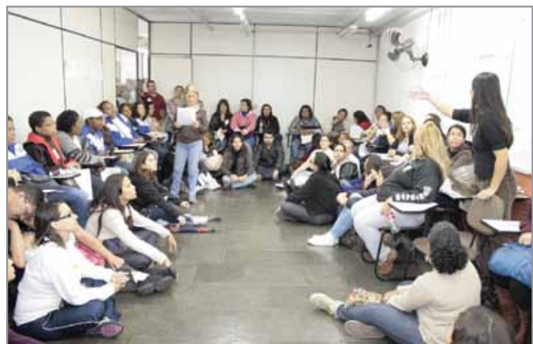
Professoras reunidas organizam a mobilização

É um verdadeiro absurdo que não pode continuar de jeito nenhum! É dinheiro sendo jogado fora, em prejuízo das crianças, dos funcionários e de toda a cidade!