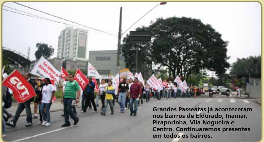
Grandes Passeatas já aconteceram nos bairros de Eldorado, Inamar, Piraporinha, Vila Nogueira e Centro. Continuaremos presentes em todos os bairros.

É esta dignidade do serviço público que estamos defendendo com nossa greve. Precisamos ter nossos direitos respeitados, e o direito à reposição da inflação que já corroe nossos salários é o mínimo que exigimos. Aliás, isto consta expressamente no Plano de Governo do atual prefeito.