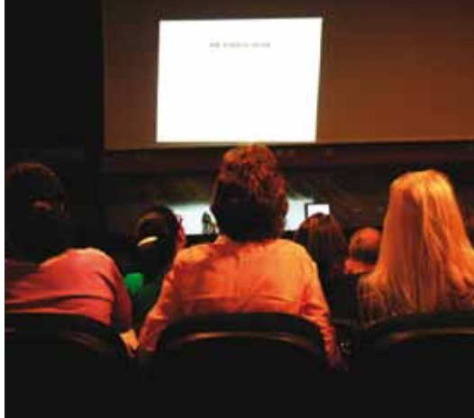
Professores/as questionam a política da Secretaria da Educação em reunião do Seção no dia 12/09/2009