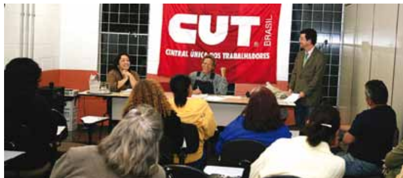
Cerca de 50 trabalhadores/as das escolas municipais participaram do debate

Os/as trabalhadores/as operacionais e administrativos das escolas municipais vão encaminhar pauta à Prefeitura reivindicando a aplicação de lei federal, sancionada pelo presidente Lula em agosto, criando os Cursos Técnicos de Formação para os profissionais da educação.